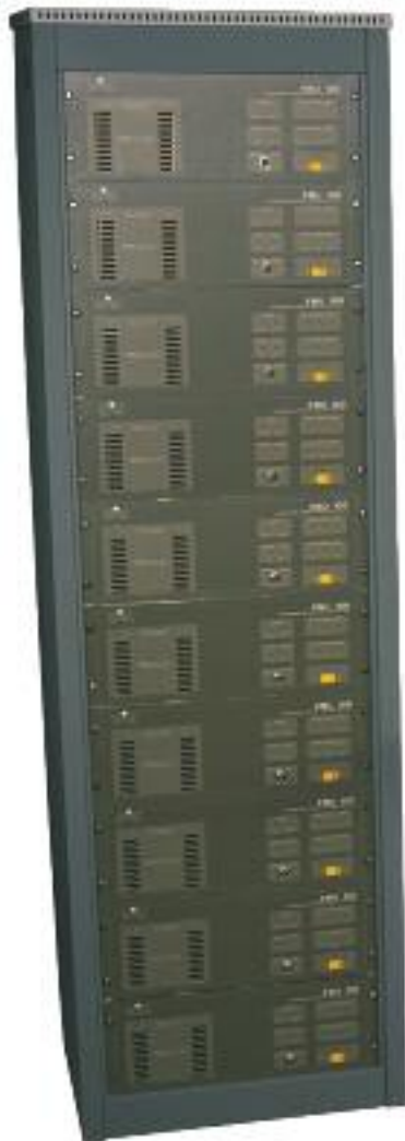
SMC-12 con 10 unidades EMU-100 instaladas